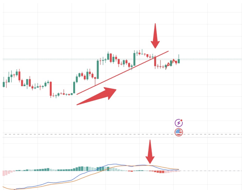
Weekly Chart 1: BingX BTCUSDT Price

Aus dem wöchentlichen Chart geht hervor, dass Bitcoin die Aufwärtstrendlinie durchbrochen hat. Im mittelfristigen Zeitraum (60 Tage bis 144 Tage) zeigt der Preis einen Abwärtstrend.