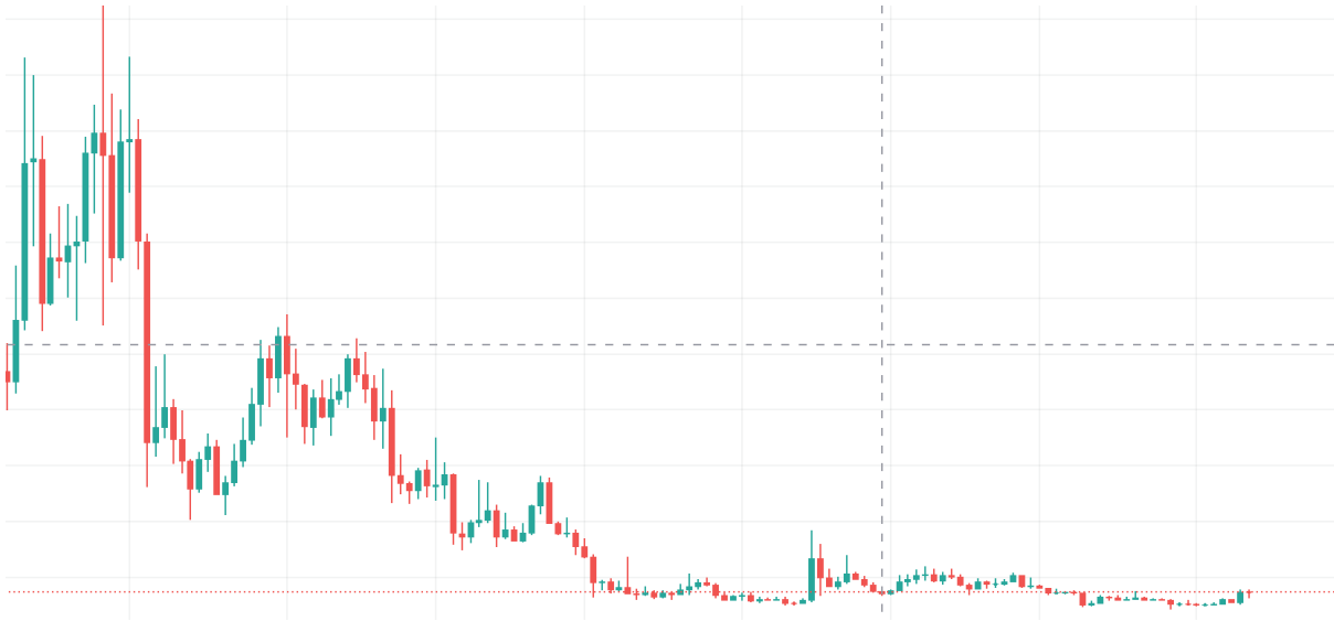
Weekly Chart 3: BingX BANDUSDT Price

Aus der Perspektive des Wochencharts von BAND befindet sich der Preis des Tokens derzeit am Tiefpunkt des Marktes. 1,28 $ dient als Unterstützungsniveau, und wenn er unter dieses Niveau fällt, könnte der Preis auf 0,98 $ fallen.