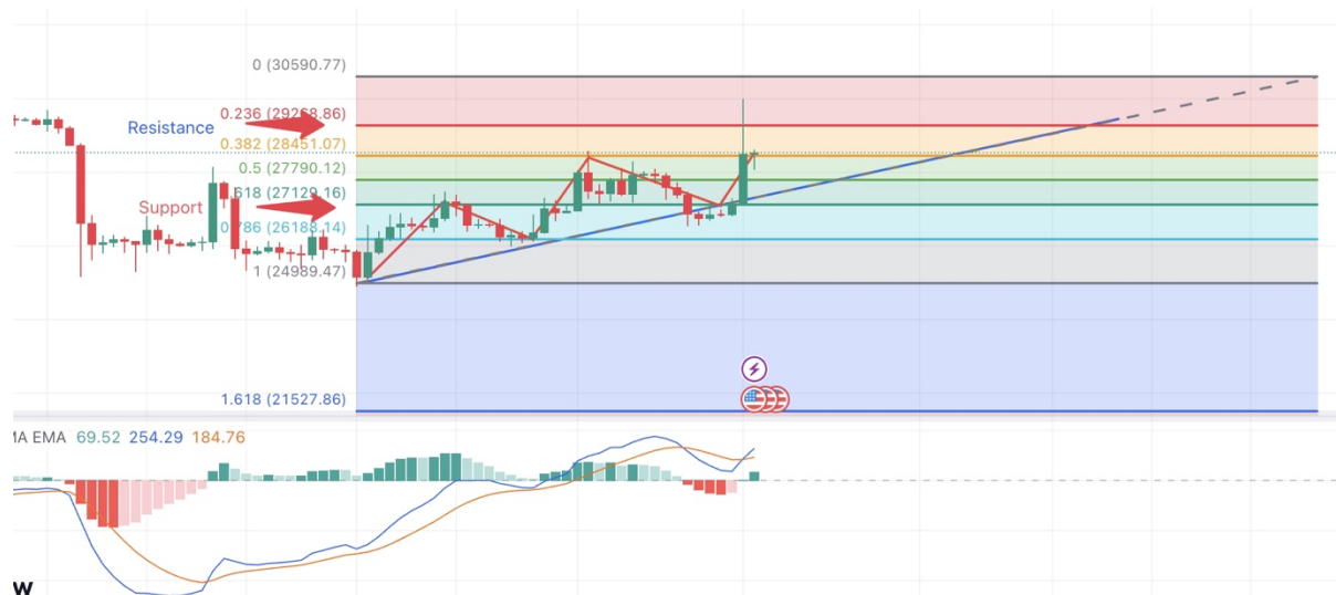
Day Chart 2: BingX BTCUSDT Price

Daher ist es ratsam, an der aktuellen Position Stop-Loss-Preise für DeFi-Token festzulegen, wie zuvor im Bericht erwähnt. Die operative Strategie kann im letzten Kapitel des Berichts gefunden werden.