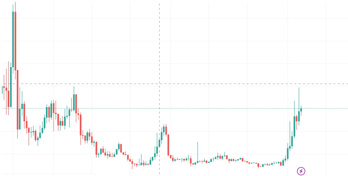
Weekly Chart 4: BingX TRBUSDT Price

Der TRB-Token befindet sich seit mehreren Monaten in einem kontinuierlichen Preisanstieg, der im August bei 10 $ begann und bis zu den aktuellen 60 $ anstieg. Dieses Wachstum kann auf das reduzierte Angebot des Tokens und die bereits erwähnten Informationen zurückgeführt werden.